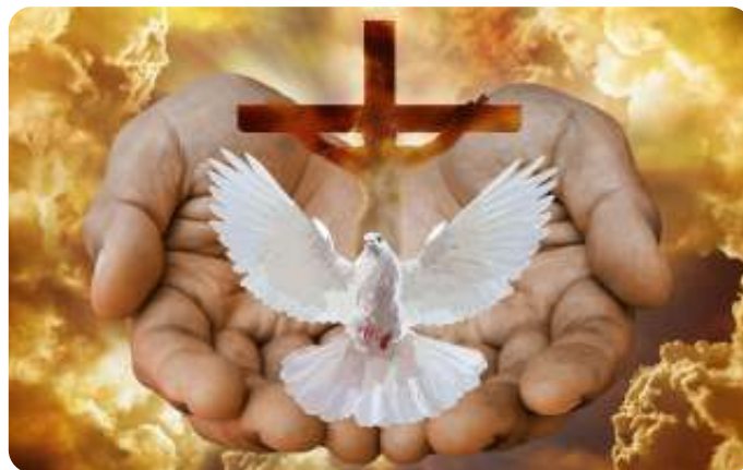
Drie - eenheid